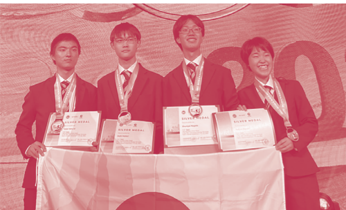
IBO2024 カザフスタン大会に出場した日本代表(2024年7月)

なお、いくつかの大学では、日本生物学オリンピックでの成績が入学試験で考慮されることがあります。(https://jbo-info.jp/admission)